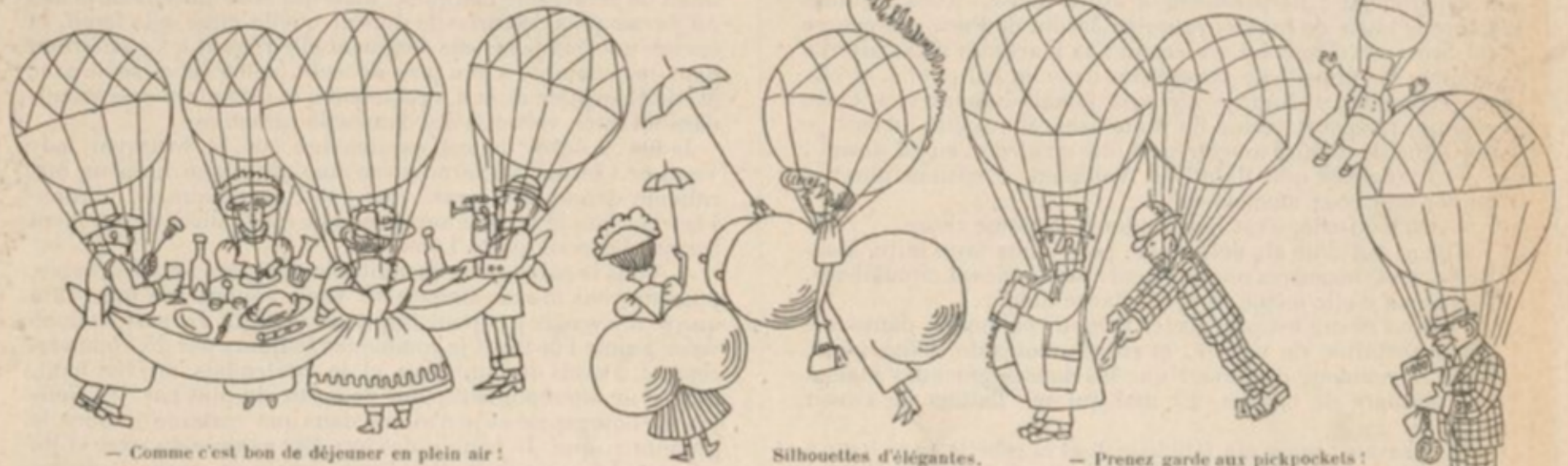
— Comme c'est bon de déjeuner en plein air !